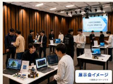
展示会イメージ © 廣徳はイノベーション