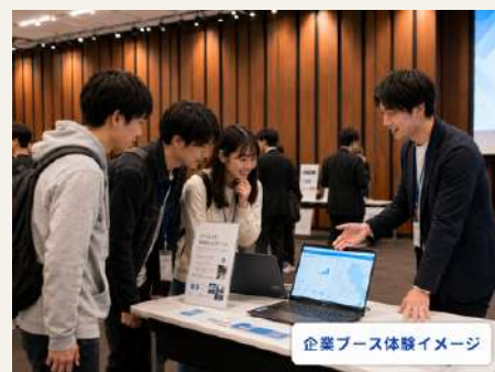
企業ブース体験イメージ